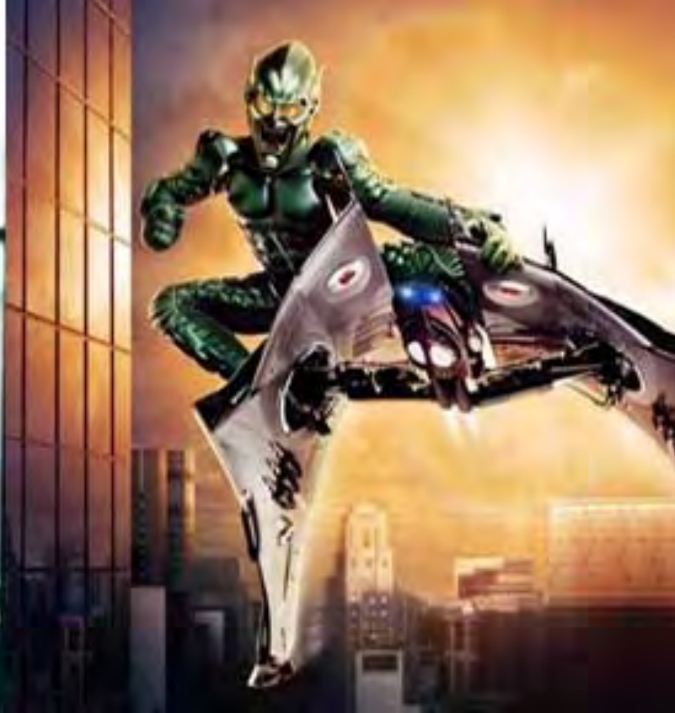
스파이더맨의 악당, 고블린